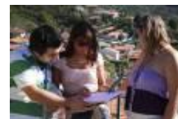
Photo Paper: Atividade de orientação e descoberta em que através de fotografias, os participantes terão que percorrer um determinado percurso, sendo atribuídas determinadas tarefas que terão de ser superadas em equipa.