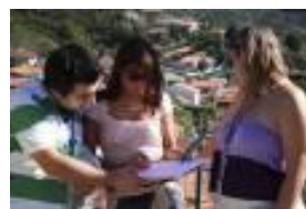
Photo Paper: Atividade de orientação e descoberta em que através de fotografias, os participantes terão que percorrer um determinado percurso, sendo atribuídas determinadas tarefas que terão de ser superadas em equipa.