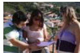
Photo Paper: Atividade de orientação e descoberta em que através de fotografias, os participantes terão que percorrer um determinado percurso, sendo atribuídas determinadas tarefas que terão de ser superadas em equipa.