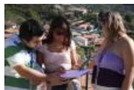
Photo Paper: Atividade de orientação e descoberta em que através de fotografias, os participantes terão que percorrer um determinado percurso, sendo atribuídas determinadas tarefas que terão de ser superadas em equipa.